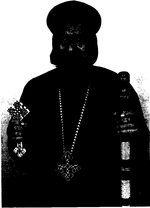
نيافة الأنبا صموئيل أسقف شبين القناطر وتوابعها