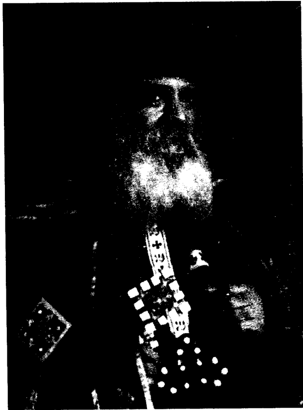
غبطة البابا المعظم الأنبا شنودة الثالث